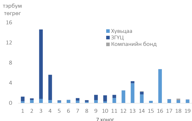
Арилжааны үнийн дүн /7 хоногоор/